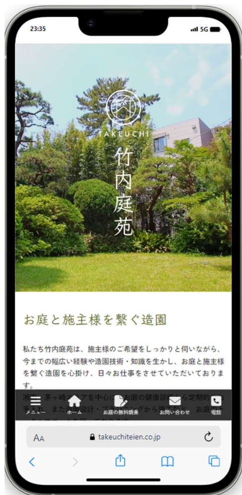
お客さまを集める